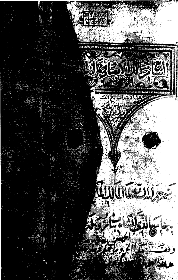
صفحة العنوان - مخطوطة أحمد الثالث - طوبقو سراي - استانبول - رقم ٢٧٩٧